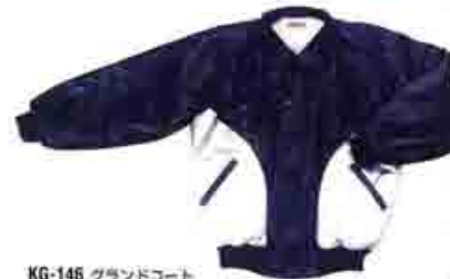
KG-146 グラウンドコート