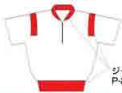
KG-46 ネイビー×ホワイト× グレー×オレンジ