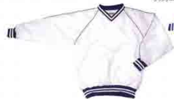
XO-45 ホワイト×ネイビー