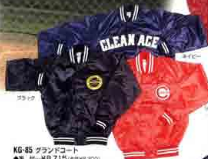
KG-85 グラウンドコート