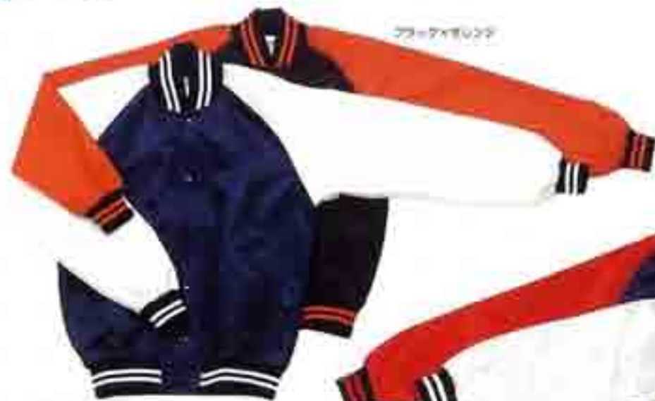
ブルー・オレンジ