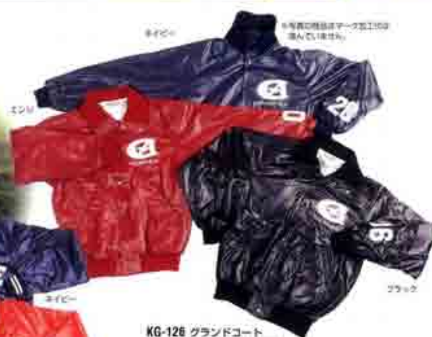
KG-126 グラウンドコート