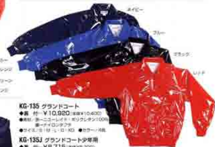
KG-135 グラウンドコート