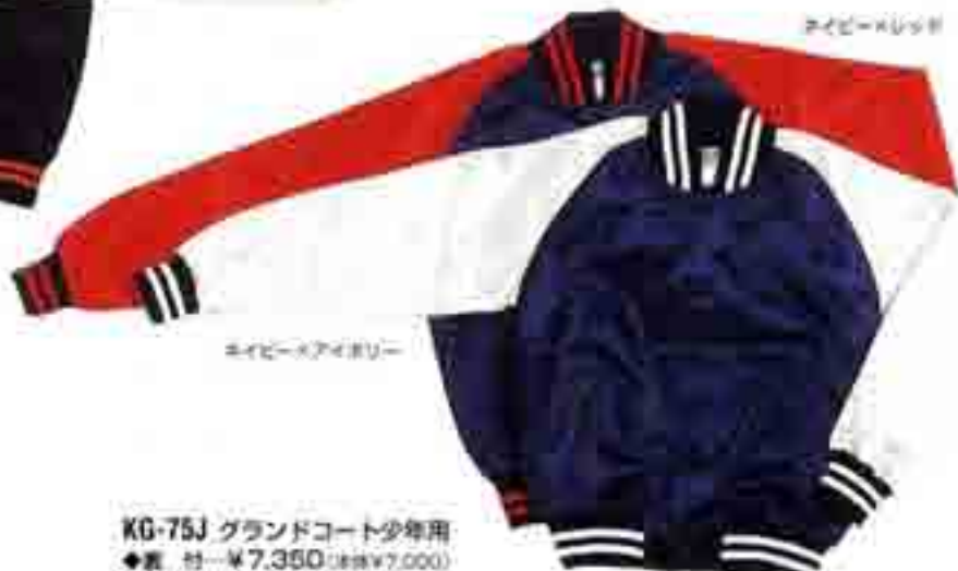
ネイビー・レッド